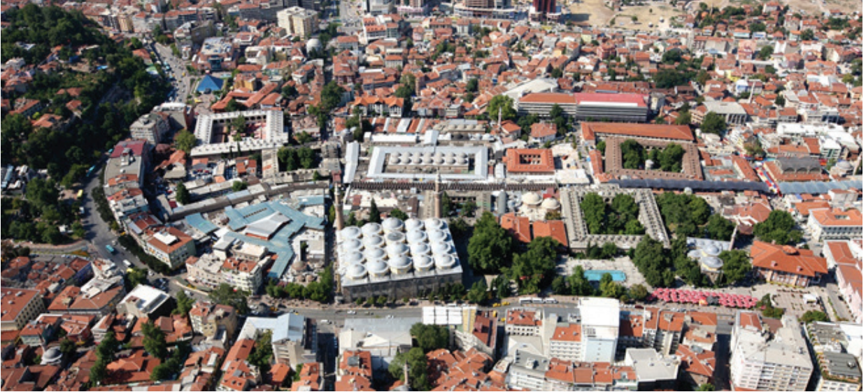
Şekil-1- Hanlar Bölgesi