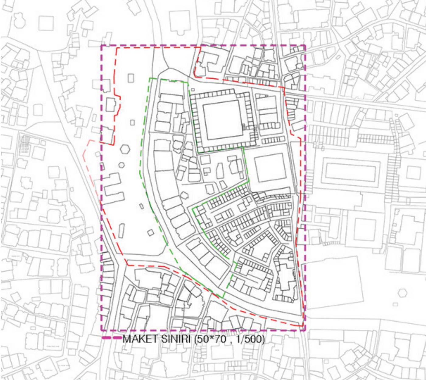
Şekil-3- Maktet Sınırı

Verili yarışma ve odak alanını kapsayan, Şekil 3'te belirtilen 1/500 ölçekli maket 50x70 cm ebatlarında yapılacaktır. Maket yapım tekniği yarışmacıya bırakılmıştır.